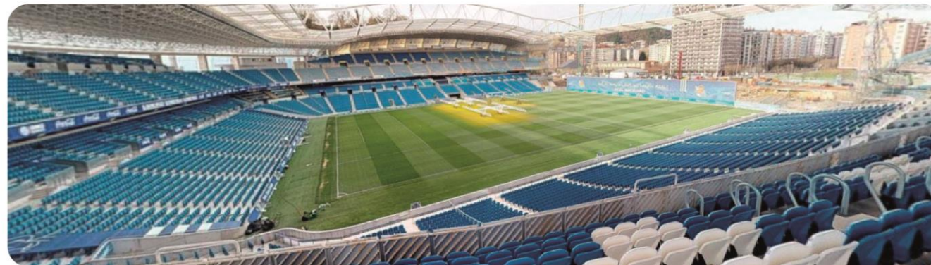
AITOR ZABALETA TRIBUNA