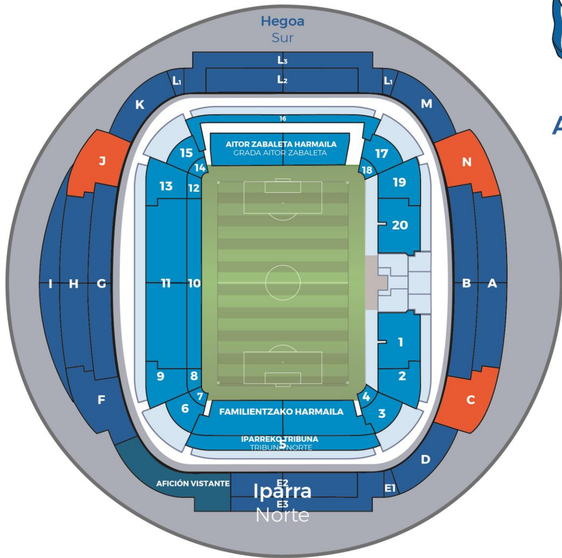
En la actualidad